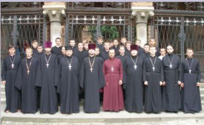
ЩОРОКУ У СВІТЛІ ІДЕ ПОЛТУЖНА ПЛЯЖА МОЛОДИХ ВИСОКОСВІЧЕНИХ БОГОСЛОВІВ-РЕЛІГІЄЗНАВЦІВ

При кафедрі діє богословське відділення, діяльність якого регламентується Угодою про спільну освітню діяльність між Чернівецьким національним університетом і Київською Духовною Академією (теперішня назва – Київська Православна Богословська Академія). Богословське відділення готує бакалаврів, спеціалістів і магістрів з вищою духовною освітою та священнослужителів для потреб Церкви